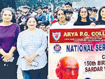
पानीपत। आर्य कॉलेज के विद्यार्थी भारत रत्न सरदार पटेल को श्रद्धांजलि देते हुए।