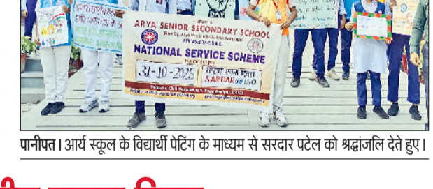
पानीपत। आर्य स्कूल के विद्यार्थी पेटिंग के माध्यम से सरदार पटेल को श्रद्धांजलि देते हुए।