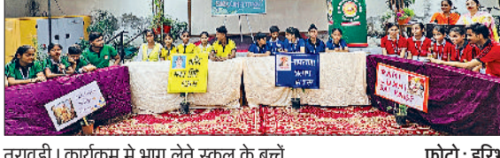
तरावड़ी। कार्यक्रम में भाग लेते स्कूल के बच्चे

हरिभूमि न्यूज। तरावड़ी गीता मॉडर्न सीनियर सेकेंडरी स्कूल के परिसर में आज बड़े उत्साह और जोश के साथ हरियाणा सामान्य ज्ञान इंटर हाउस प्रतियोगिता का आयोजन किया गया। इस प्रतियोगिता का उद्देश्य विद्यार्थियों में राज्य से जुड़ी ऐतिहासिक, सांस्कृतिक और भौगोलिक जानकारी को बढ़ावा देना था। प्रतियोगिता में विद्यालय के चारों हाउस, रानी लक्ष्मीबाई हाउस, शाहीद भगत सिंह हाउस, छत्रपति शिवाजी हाउस, और महाराणा प्रताप हाउस ने पूरे उत्साह के साथ भाग लिया। कड़ी प्रतियोगिता के बीच रानी लक्ष्मीबाई हाउस ने उत्कृष्ट