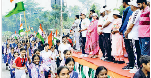
करनाल। रन फॉर यूनिटी में दौड़ में शामिल विशाल जन समूह।