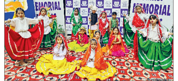
तरावड़ी। कार्यक्रम में भाग लेते एसएमएस पब्लिक स्कूल के बच्चे।

शुरुआत दीप प्रज्वलन एवं सरस्वती वंदना के साथ हुई बच्चों की प्रतिभा को देखकर हर कोई हुआ अर्चयित